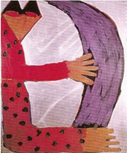
La obra: Sin título (1983)

En la composición, de gran simplicidad, aparece a la izquierda un extraño personaje que sostiene una forma esférica (¿quizá un cuerno, tal vez la luna?), dirigiendo su mirada al espectador. La intensidad cromática y compositiva nos retrotraen a las influencias del fauvismo matisiano, el expresionismo y la fusión de elementos pop, que se amalgaman en una pintura de gran expresividad cromática y un fuerte impacto visual. La iconografía tiene componentes míticos del sustrato popular de Galicia y, por otra parte, conecta con los arcanos del subconsciente simbólico que hay en todas y todos nosotros.