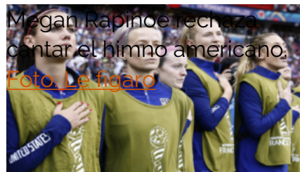
Megan Rapinoe rechaza cantar el himno americano.

En 2012, fue una de las primeras jugadoras en hacer su coming-out , justo antes de los Juegos Olímpicos en Londres, donde ganó con su equipo el oro olímpico. Cuatro años después, en 2016, fue la primera deportista en unirse al movimiento de boicot del himno americano, lanzado el mismo año por Colin Kaepernick, para protestar en contra de las violencias policiales contra la población negra. Durante el Mundial 2019, siguió con el boicot al himno para mostrar su oposición a la política del presidente Trump.