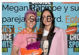
Megan Rapinoe y su pareja, Sue Bird.

Este mundial fue también excepcional para ella a nivel deportivo porque, además de ser campeona del mundo con sus compañeras, Megan fue designada mejor jugadora y mejor goleadora del campeonato. El 2 de diciembre, Megan Rapinoe ganó también el Balón de oro 2019, el segundo Balón de oro femenino de la historia, después de Ada Hegerberg en 2018 ( ver artículo https://revista.conlaa.com/el-primer-balon-de-oro-femenino/ ).