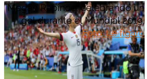
Megan Rapinoe celebrando un gol durante el Mundial 2019.

Además de su talento indiscutible de futbolista, son su personalidad y sus convicciones personales y políticas las que explican un entusiasmo mediático tan importante. Figura feminista, lesbiana asumida y opuesta a la política de Donald Trump, Megan Rapinoe, con su pelo rosa, ha conquistado el corazón de numerosas personas, incluso el de quienes no se interesan por el fútbol.