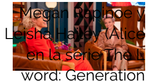
Megan Rapinoe y Leisha Hailey (Alice en la serie The L word: Generation Q).

Y como si hiciera falta comprobar su fama en el mundo LGTBI, los y las fans de Megan Rapinoe tuvieron el placer de verla, hace algunas semanas, en el tercer capítulo de la serie The L word: Generation Q , en la que hace una aparición desempeñando su propio papel en el show de Alice Pieszecki ( interpretada por Leisha Hailey ).